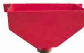
Pour soupapes grands débits DN 50 - 65

Tôle laquée rouge pour grands modèles DN 50 & 65