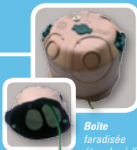
Boîte faradisée étanche à l'air