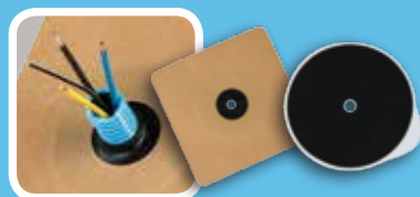
Membrane & œillet