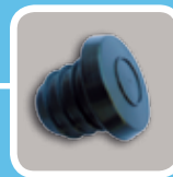
Bouchon RT plus d'étanchéité et une meilleure isolation