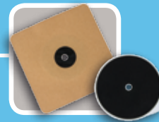
Membrane & œillet

Ce système breveté permet de préserver tout individu des champs électromagnétiques 50 Hz dans l'habitat.