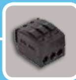
Connecteur automatique de liaison des installations à la terre