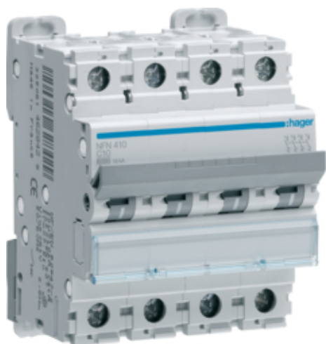
Disj.4P 6-10kA B-63A 4m

Photo non contractuelle. Référence présentée : NFN410