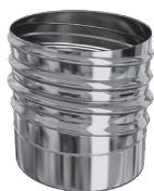
ADAPTATEUR INOX À VISSER sur tubage flexible TEN LISS