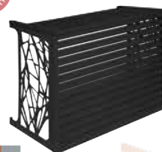
Gamme Confort couleur gris anthracite