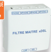
Filtre Maître xDSL 4 sorties RJ45 (Q 209)