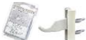
27- Consoles universelles blanches blister (paire)