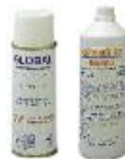
10- Bombe aérosol de peinture 18- Liquide Cillit HS 23 Combi