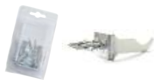
29- Consoles équerres à visser blanches blister (paire)