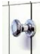
237 - poignée blanche 238 - poignée chromée