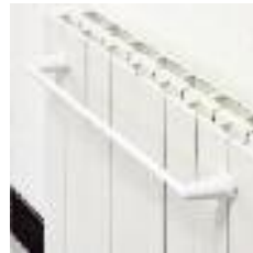
BARRE/SERVIETTE 201 - cm 48 blanche 202 - cm 48 chromée 207 - cm 32 blanche 208 - cm 32 chromée

5- vernis 6- galvanisé 20- vernis avec joint silicone