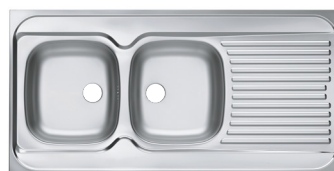
SCHÉMA TECHNIQUE :